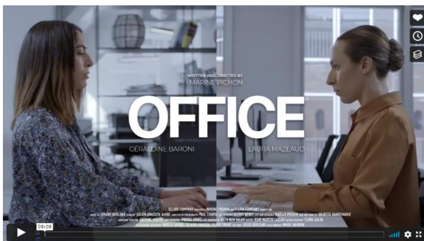
Office, 2021 Court-métrage dansé