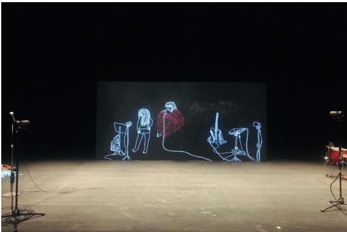
Répétitions CDN de Normandie-Rouen.

Dessiner-écrire, danser-bouger, chanter-parler : il s'agit de faire nos premiers pas d'Hommes et de Femmes, ensemble, sans rivalité, avec au contraire beaucoup de complicité et d'amusement, et tenter un geste de réécriture de notre Histoire.