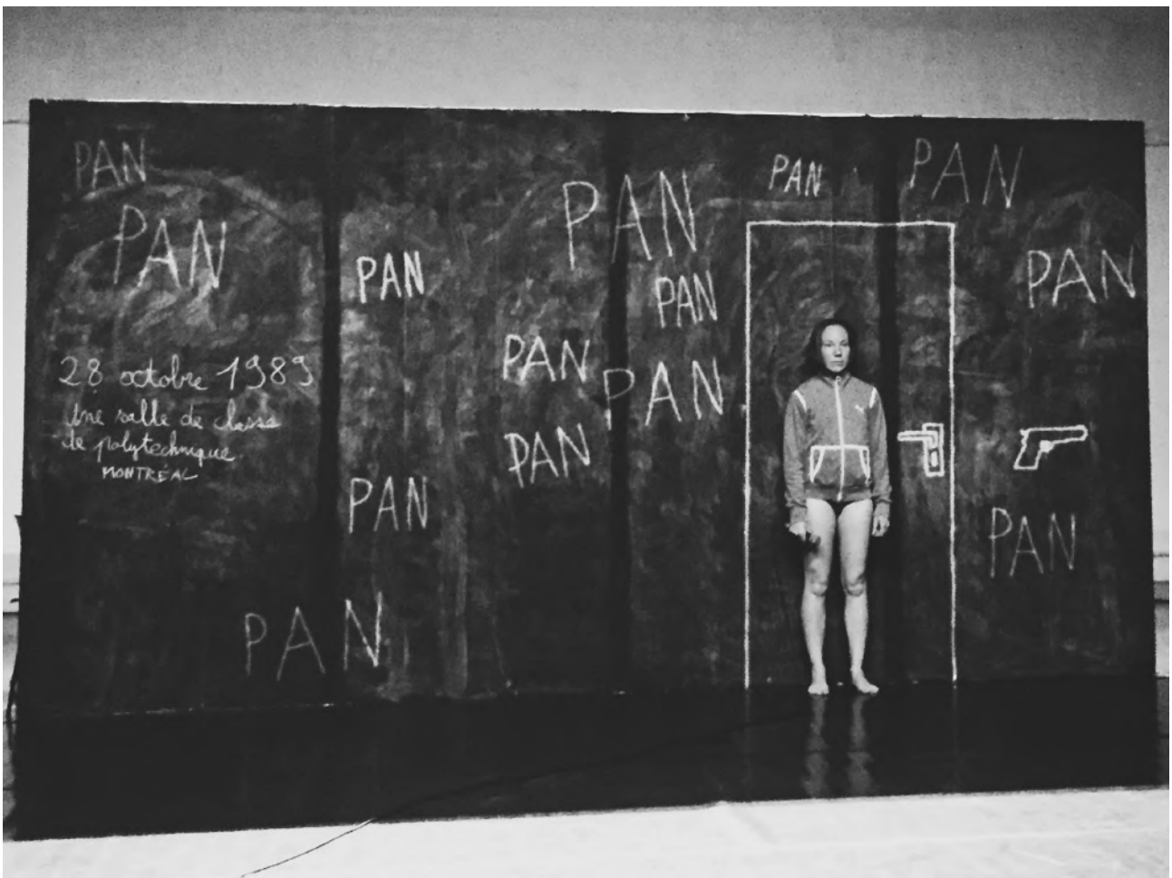
Répétitions Halle aux Granges, Caen

Cette forme nous permettra d'aller au plus près des adolescents pour échanger avec eux sur les sujets que nous abordons autour du féminin et du masculin. Nous espérons de vifs échanges et des réactions qui nous bousculeront autant que nous souhaitons les faire s'interroger sur leurs habitudes, leurs acquis, leurs normes.