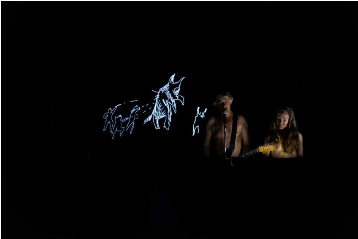
Larmes de crocodile

C'est d'abord l'écriture directe et sans fard de Virginie Despentes dans « King Kong théorie » qui nous a donné envie de questionner les codes du féminin et du masculin, mais ce sont les recherches anthropologiques de Françoise Héritier sur les origines de la hiérarchisation des sexes, et les BD étonnantes de Liv Stömquist qui nous ont mené à ces personnages « premiers êtres humains » de l'histoire de l'humanité, naïfs comme des enfants qui ont tout à découvrir, et en même temps complètement omniscients, donc des personnages qui nous permettent une grande liberté pour questionner, réécrire, réinventer, rejouer l'histoire des femmes et des hommes, et interroger les codes, les normes, les habitudes, les acquis de notre Histoire fondée sur des millénaires de patriarcat.