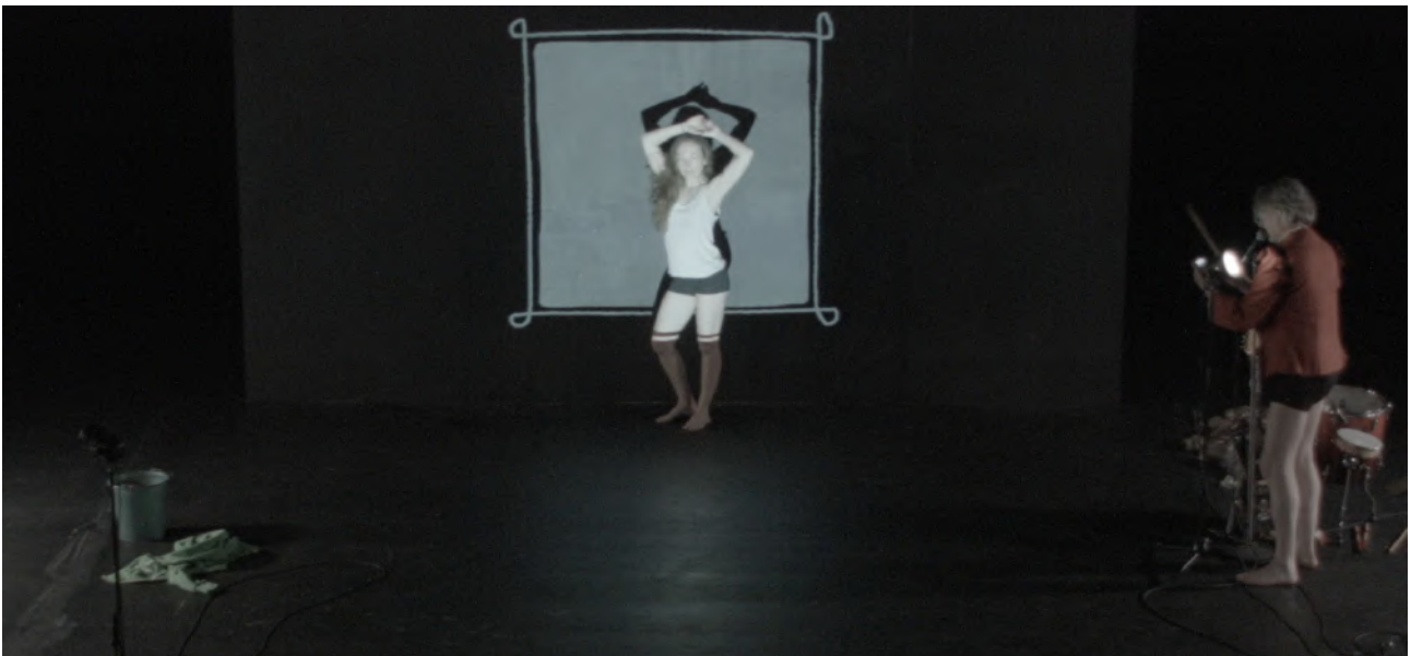
Répétitions CDN de Normandie-Rouen