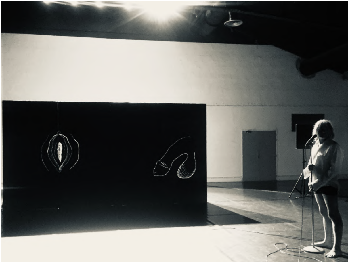
Répétitions, Halle aux Granges, Caen.