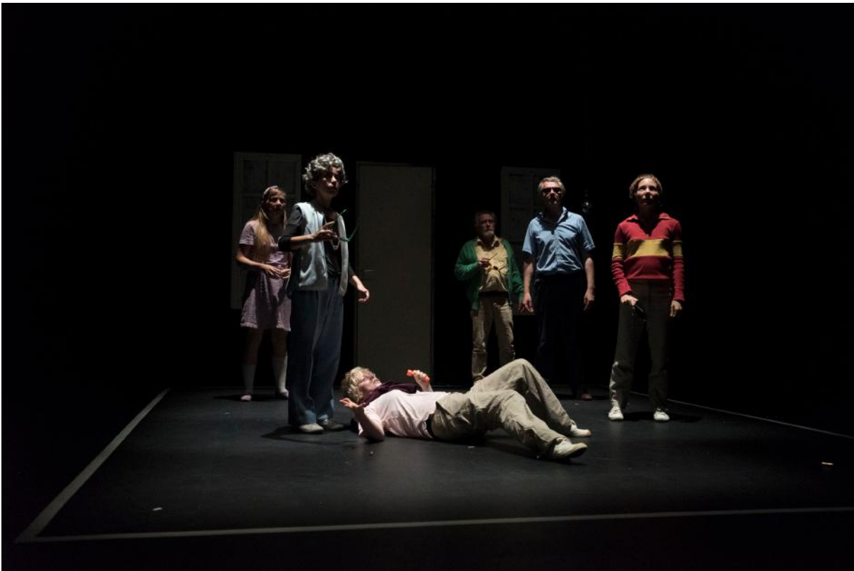
FROUSSE, photo Fred Hocké.

Par ailleurs, nous envisageons de mettre en place une version de « Larmes de crocodile » pour salles de classe, qui sera donc créée et jouée uniquement et spécialement dans des salles de classe, pour les élèves (en lycées essentiellement).